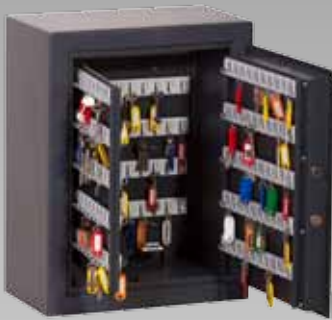
Abb.: STZ 200

Einbruchsicherheit: Sicherheitsstufe S2 nach EN 14450 und Sicherheitsstufe B nach VDMA 24992 (Stand 05/1995)