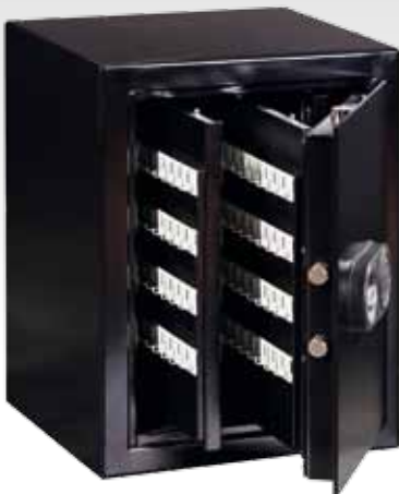
Abb.: STZ 490 mit Sonderausstattung EZ