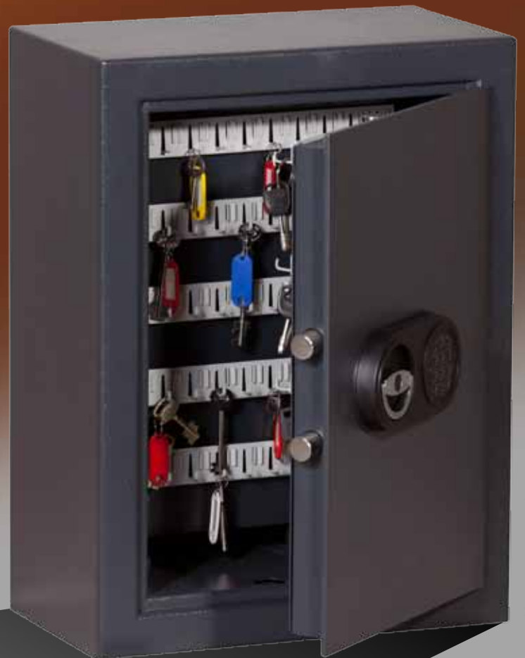
Abb.: STZ 100 mit Sonderausstattung EZ