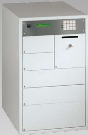
Abb.: MC 83-6-FAAC

MCA 68 – 6 – ABHH – r Gehäuse – Anzahl der Schublade – Schubladen-Modul – Ergänzendes Ausstattungsmodul