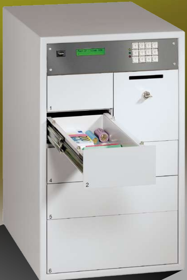
Abb.: MC 83-6-FAAC

Jeder Auszug mit Öffnungs- verzögerung programmierbar