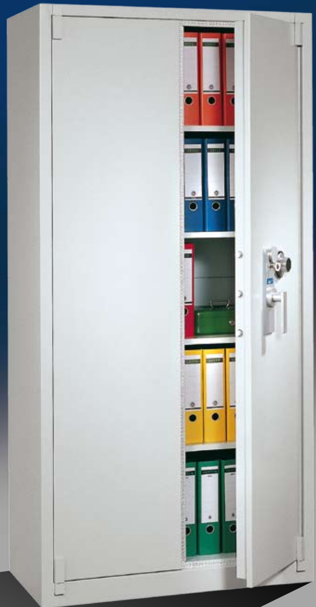
Abb.: BS 1100 (mit Sonderausstattung zusätzlichem ZKS)

Tür dreiwandig; Stahlschrank über alle Kanten gebogen und sorgfältig verschweißt