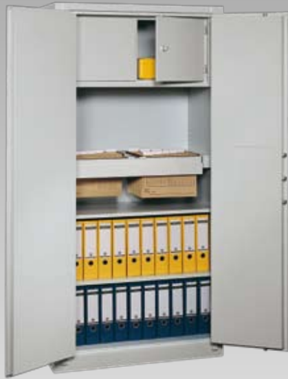
Abb.: BS 1100 (mit Sonderausstattung Innentresor und Teleskopauszug)