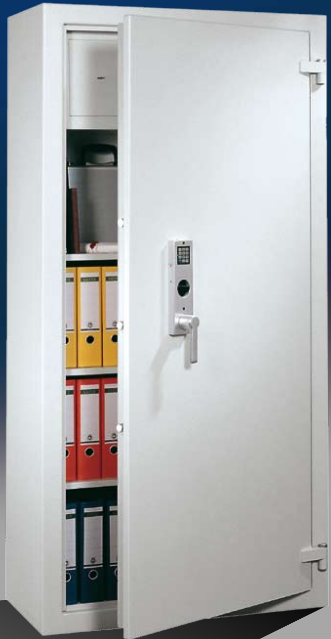
Abb.: DK 195/2 (mit Sonderausstattung EZ und Innentresor)