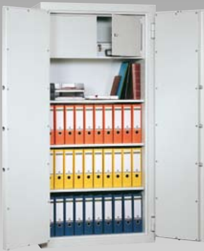
Abb.: DK 195/3 (mit Sonderausstattung Innentresor)