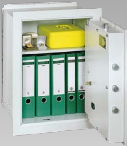
Abb.: VCO 6