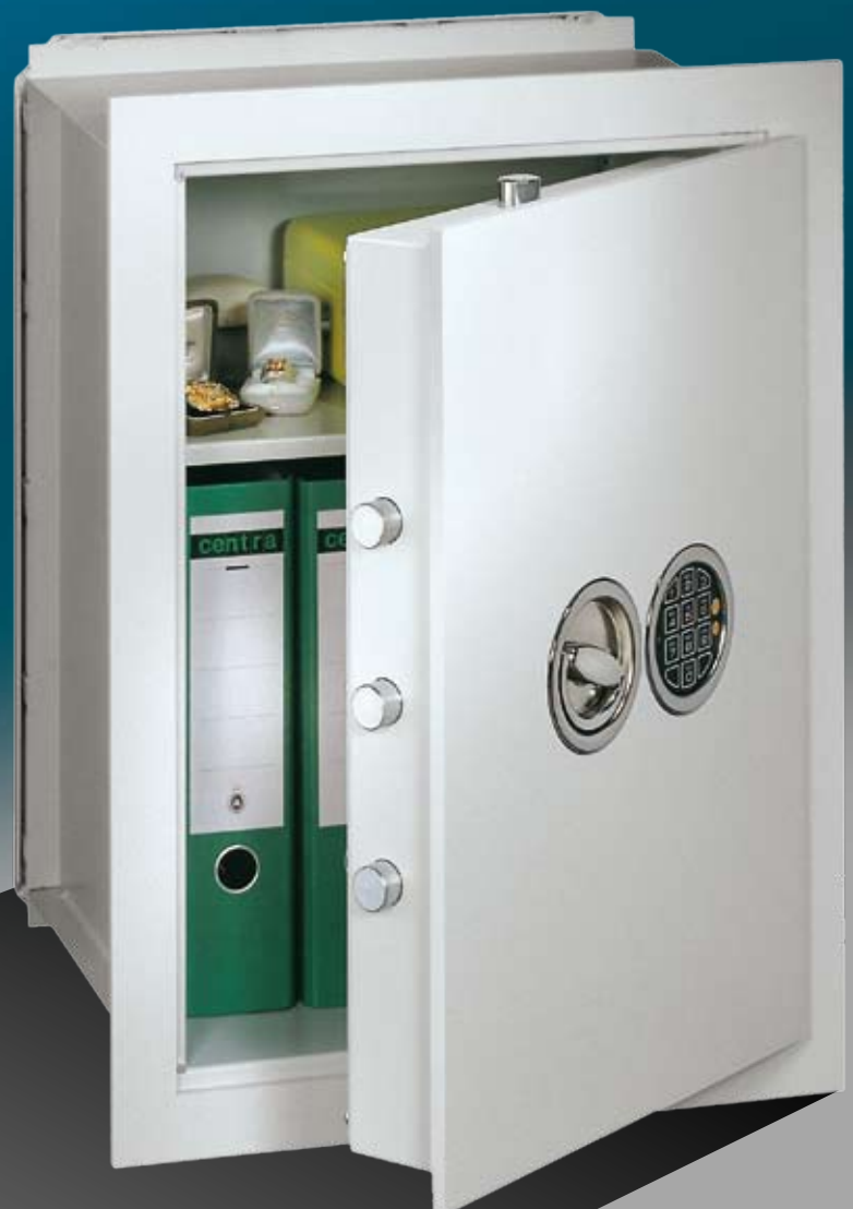
Abb.: VCO 6 (mit Sonderausstattung EZ LG Basic versenkt)