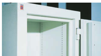
Durchgehende Stellleisten für Fachböden Verstellmöglichkeit für Fachböden im Raster von 15mm