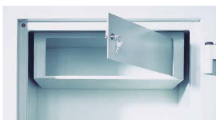
Separat verschließbares Innenfach (Sonderausstattung)