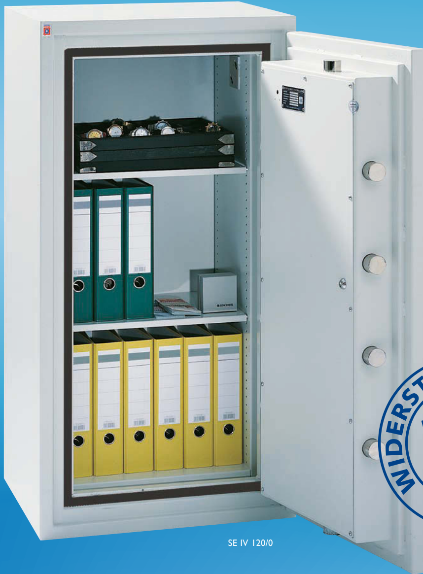
SE IV 120/0