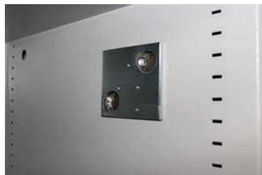
Vorbereitung für eine Alarmkomplettausstattung