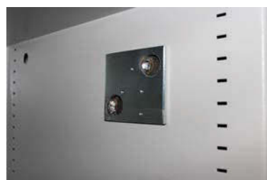
Vorbereitung für eine Alarmkomplettausstattung