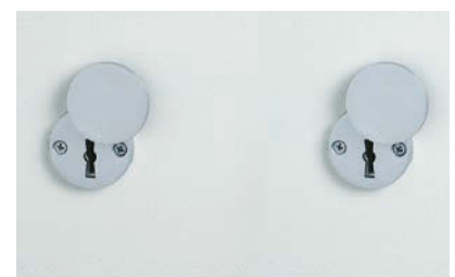
Grundausrüstung: 2 x DSS mit Schlüsselrosette (Standard)