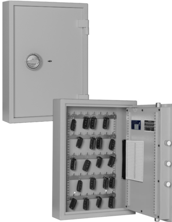
ST 35 AS S1 Lichtgrau • light grey Dekoration nicht im Lieferumfang enthalten • decoration not included in the delivery

Autoschlüsseltresor, S1 (EN 14450) und A (VDMA 24 992, Ausgabe Mai 1995) Car key cabinet, Security level S1 (EN 14450) and A (VDMA 24 992, May 1995 edition)