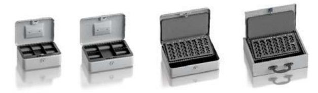
Ludwigsburg modelle 63400.00

Staufächer. Außenmaße 53*250*52 mm (Innen 52*247*49 mm), Art. 850119.11 (bei Modellen 564152.00 - 564154.00)