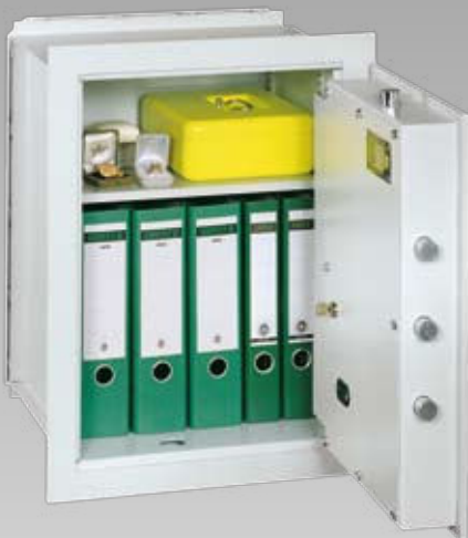
Abb.: VNO 6