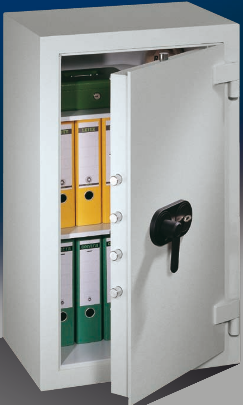
Abb.: EV 1-100

Fachböden ordnertief; vierseitige Bolzenverriegelung