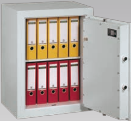
Abb.: EV 1-80