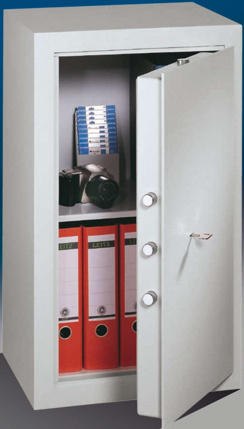
Abb.: MLE 81